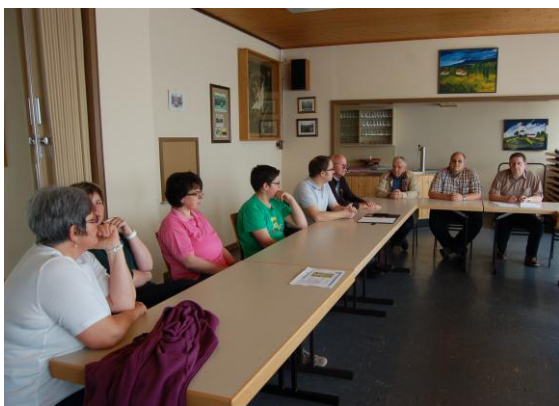
Die Ergebnisse des Rundganges und die Ideen für die künftige Ortsentwicklung wurden im Rahmen des anschließenden Workshops im DGH diskutiert.