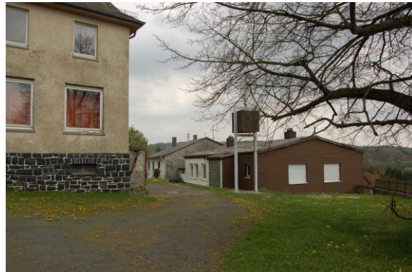
Blick auf die Alte Schule (links) und DGH (rechts)