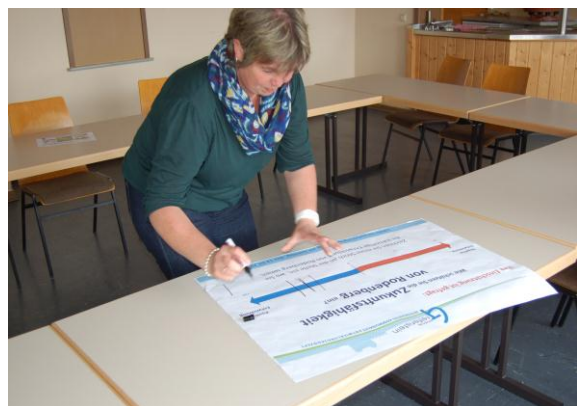
In einer Momentaufnahme schätzen die Teilnehmerinnen und Teilnehmer die Zukunftsfähigkeit von Rodenbergs ein.