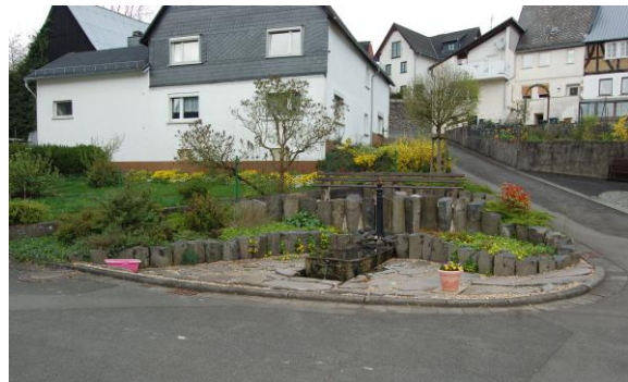
Blick auf den Brunnen in der Dorfmitte, der auch mit großem Bügereinsatz realisiert wurde.