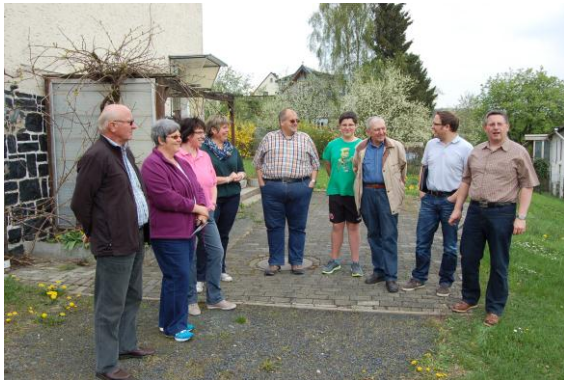
Die Teilnehmerinnen und Teilnehmer des Ortsrundganges diskutieren auf dem Vorplatz der Alten Schule über die Stärken und Schwächen des Ortes

Lokale Veranstaltung Rodenberg am 12.04.2014 Zusammenfassung der Ergebnisse