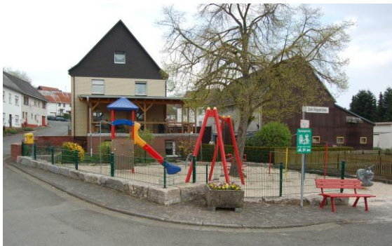
Der Spielplatz im Ortskern wurde durch Eigenengagement der Bürgerschaft erneuert.