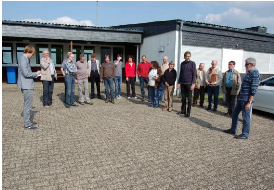
Die Teilnehmerinnen und Teilnehmer des Ortsrundganges stehen auf dem Vorplatz des Dorfgemeinschaftshauses.

Lokale Veranstaltung Rodenroth am 12.04.2014 Zusammenfassung der Ergebnisse