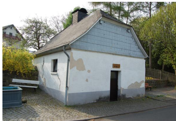
Das sanierungsbedürftige alte Backhaus in der Brunnenstraße.