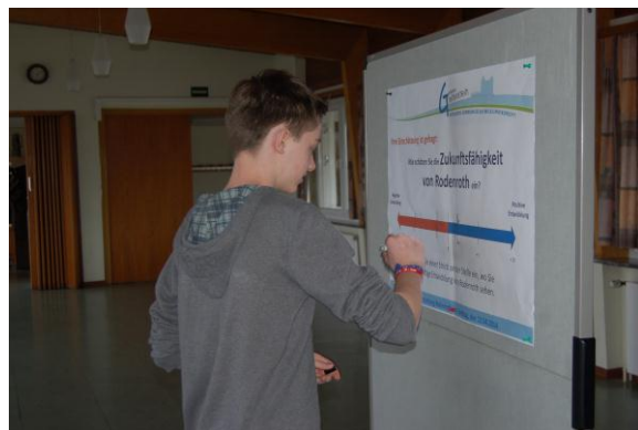
In einer Momentaufnahme bewerten die Teilnehmerinnen und Teilnehmer die Zukunftsfähigkeit ihres Dorfes