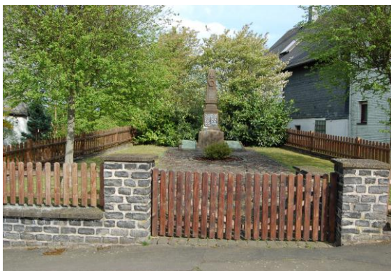
Ehrenmal im historischen Ortszentrum neben dem Privatgebäude mit Backhaus.