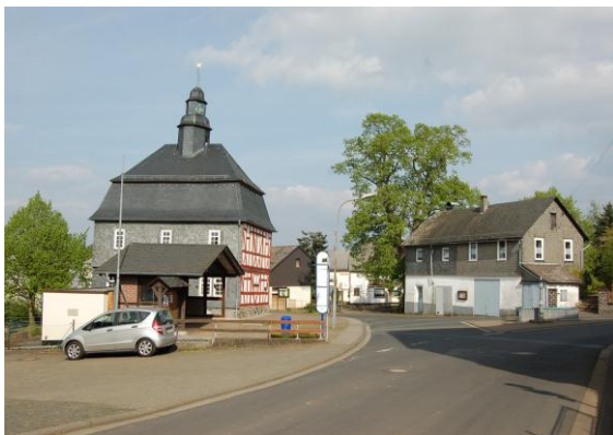
Blick auf die historische Ortsmitte. Links die Alte Schule und rechts das private Gebäude mit Backhaus.