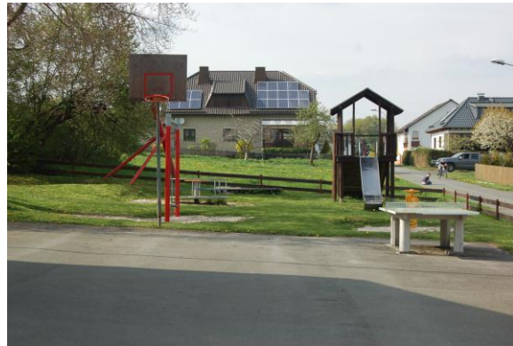
Der Kinderspielplatz hinter dem Dorfgemeinschaftshaus.